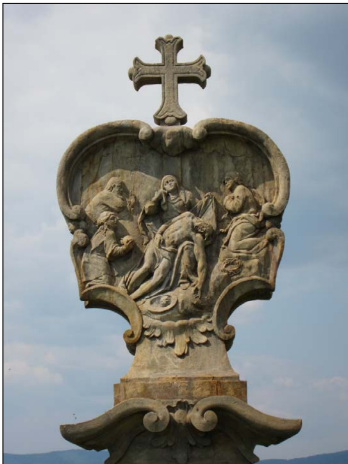
13. zastavení křížové cesty na Křížovém vrchu v Rudě

Přijměme výzvu Pána Ježíše k jeho následování, učme se chápat smysl kříže, vlastních nehod a utrpení a využijme příležitosti k vlastnímu sebezsvěcování i modlitbě za kraj, na němž leží tíha sudetské minulosti.