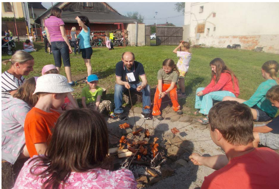
maminky ze Skřítků Kvítka

Katolickém domě a potom jsme se všichni přesunuli na farní zahradu, kde se opékaly párky. Chtěly bychom poděkovat skautkám, světluškám, tatínkům a všem ostatním, kteří nám pomohli akci uskutečnit.